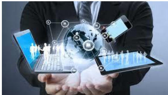
IoT to IoB